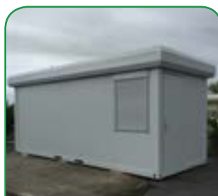
à gauche : modèle de container d'accueil