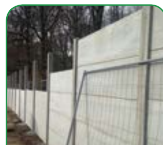
à droite : mur d'enceinte en construction

Il est dommage de devoir arriver à de tels travaux pour pouvoir permettre aux administrés de bénéficier d'un service public nécessaire à leur cadre de vie. Pour information, ce sont près de 7 800 passages qui sont en moyenne enregistrés chaque année, et sur la totalité du territoire, environ 20 communes utilisent ce point propre.