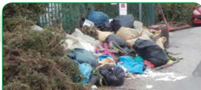
Exemple de dépôt sauvage devant le point propre

Nous vous rappelons donc qu'il est important de respecter ce lieu qui appartient à tous.