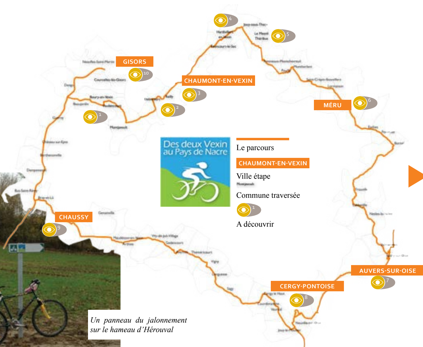
Un panneau du jalonnement sur le hameau d'Hérouval

N'hésitez pas à le demander auprès du service tourisme de la Communauté de Communes du Vexin-Thelle : 03 44 49 41 57 / ccarreras@vexinthelle.com