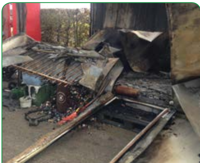
Le local du gardien et les filières piles et capsules à café après l'incendie