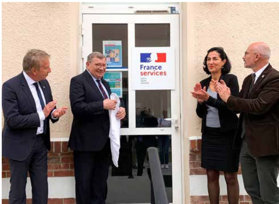
Inauguration de l'antenne France Services du Vexin-Thelle, qui vous accueille dans les locaux de la CCVT.

Renseignements : Centre Social Rural du Vexin-Thelle au 03 44 49 01 80 ou sur france-services.gouv.fr